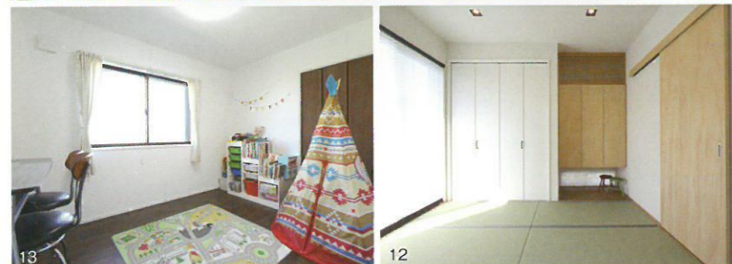
7.玄関ホールの照明もこだわりが。可愛い雰囲気の照明は、まるでカフェのような雰囲気を醸し出してくれる 8.木のぬもり溢れるLDK。天井にも無垢材をふんだんに使って心地よさを演出! 9.空間のアクセントにもなるニッチ 10.ラグジュアリー感溢れる洗面台には、個性的なタイルを加えて遊び心を演出! 11.キッチン後ろにある、造り付けのカウンターは収納力もバッチリで、時短家事には欠かせない 12.子供のお昼寝などにも使える和室。ここにも無垢材を贅沢に使い、温もりを意識した空間に 13.将来のことも考慮し、子供部屋は個性的な壁紙などを設けずシンプルに