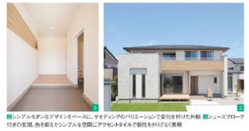
■シンプルモダンなデザインをベースに、サイディングのバリエーションで変化を付けた外観 ■シューズクローゼットの玄関、色を抑えたシンプル空間にアクセントタイルで個性をさりげなく表現