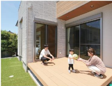
■対面キッチンは壁を高く設定し、作業の手元がダイニングから見えにくいように配慮されている。壁際のグレートとカウチのベージュ、天井の茶色のカラーコーディネートが絶妙にマッチ ■ダイニングと和室は障子で仕切れることもできる。障子から透ける光や間接照明が、洗練された和モダン空間を演出 ■ウッドデッキにはリビングと和室の両方から出入りできる。夏になったらプール遊びやバーベキューをするのが楽しみ