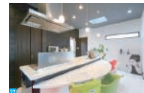
ダイニングテーブルと一体になったオーダーメイドのおしゃれなアイランドキッチン。配膳もお片づけもしやすいので、忙しい子育てママの家事負担を軽くしてくれる。