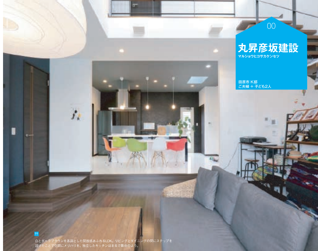
白とダークブラウンを基調とした開放感あふれるLDK。リビングとダイニングの間にステップを設けたことで空間にメリハリを。独立したキッチンまるまるで舞台のよう。