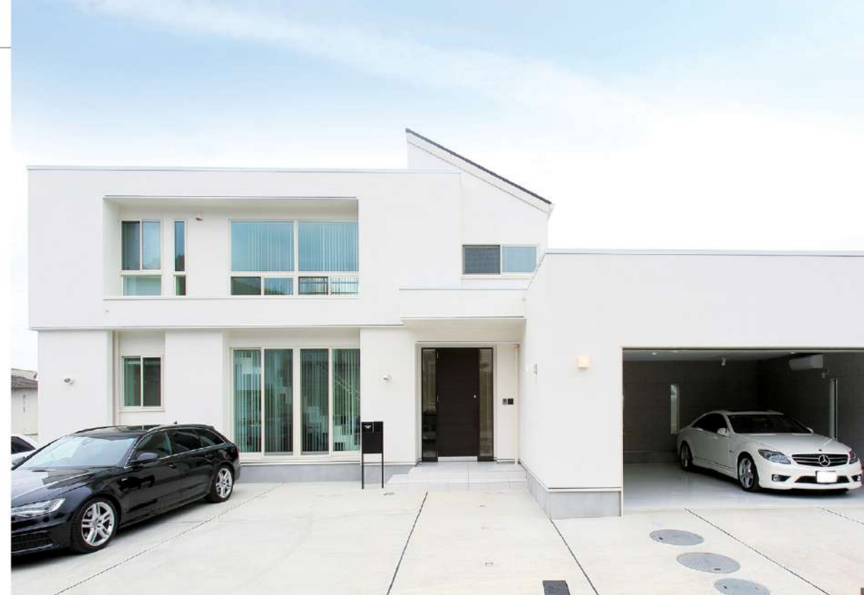
■スタイリッシュなモダンデザインが素敵な白いガレージハウス。「ヒコケン」ならではの高い設計力と施工力を駆使して、独創的なフォルムと快適な住みごころを実現した。